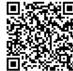
ホームページお知らせ一覧