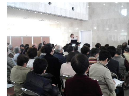
真剣に講演を聞いている来場者様