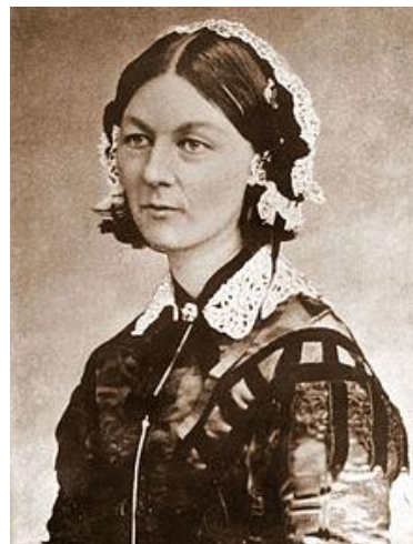
フローレンス・ナイチンゲール (1820年5月12日 - 1910年8月13日)

日本は2025年に向けた医療ニーズ増大に対応する看護職員の確保が課題となっています。千葉県は看護師不足で全国ワースト3に入っています。地域医療を守るためにも多くの若者が看護師を目指してくれることを切望しています。