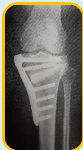
骨切り術後のレントゲン